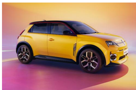
rumena Pop! (1)