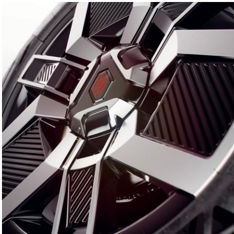
45-cm (18") platišča iz lahke litine Techno z diamantnim leskom