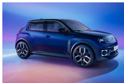
modra Nocturne (2)