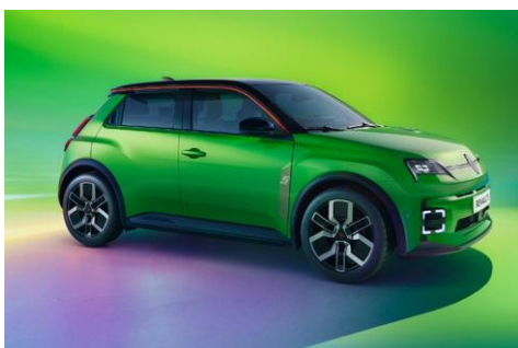
zelena Pop! (1)