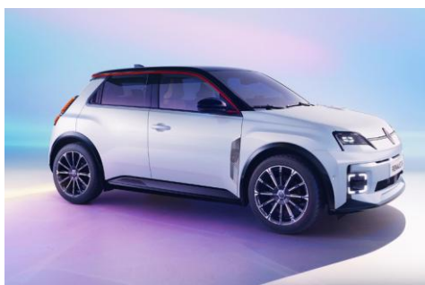
perla bela (3)