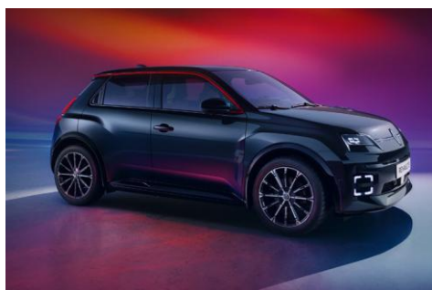
črna Etoile (2)