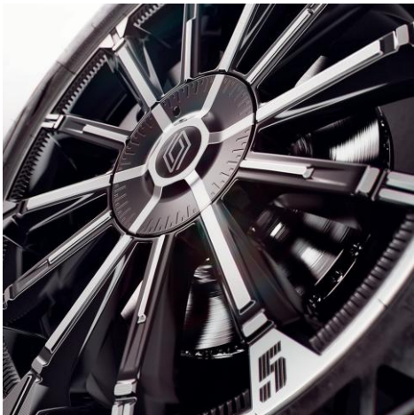
45-cm (18") platišča iz lahke litine Chrono z diamantnim leskom